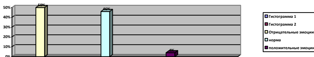
Рисунок 3. Результаты показателя социальных эмоций по методике «Домики»