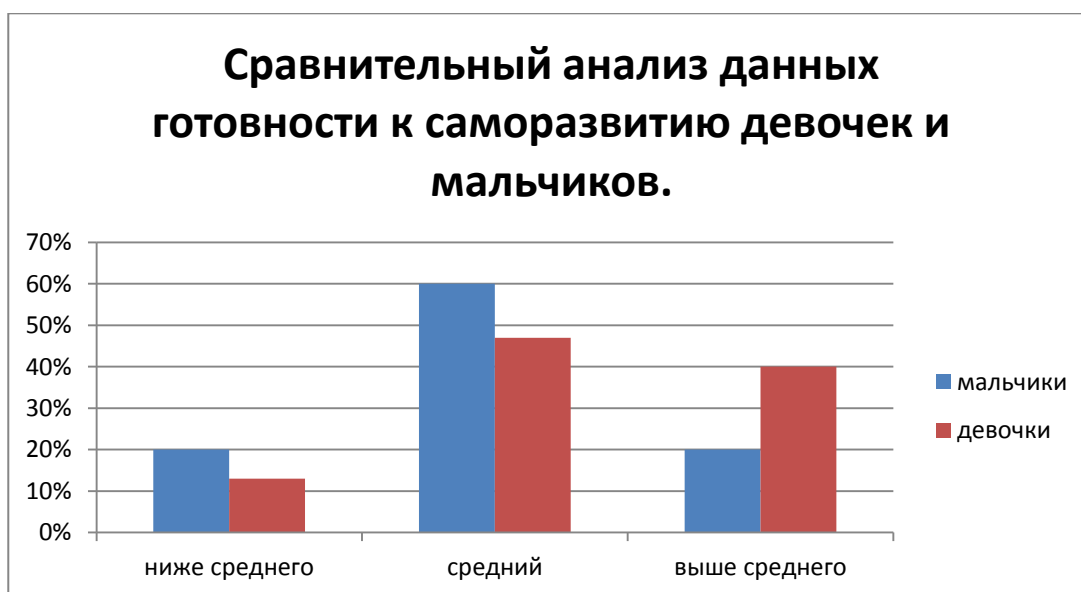
Рисунок 1. Сравнительный анализ данных готовности к саморазвитию девочек и мальчиков.

По результатам данного диагностического инструментария была дана оценка уровня стремления к саморазвитию, самооценки своих качеств, способствующих саморазвитию, оценку возможностей реализации себя, у подростков данной выборки.