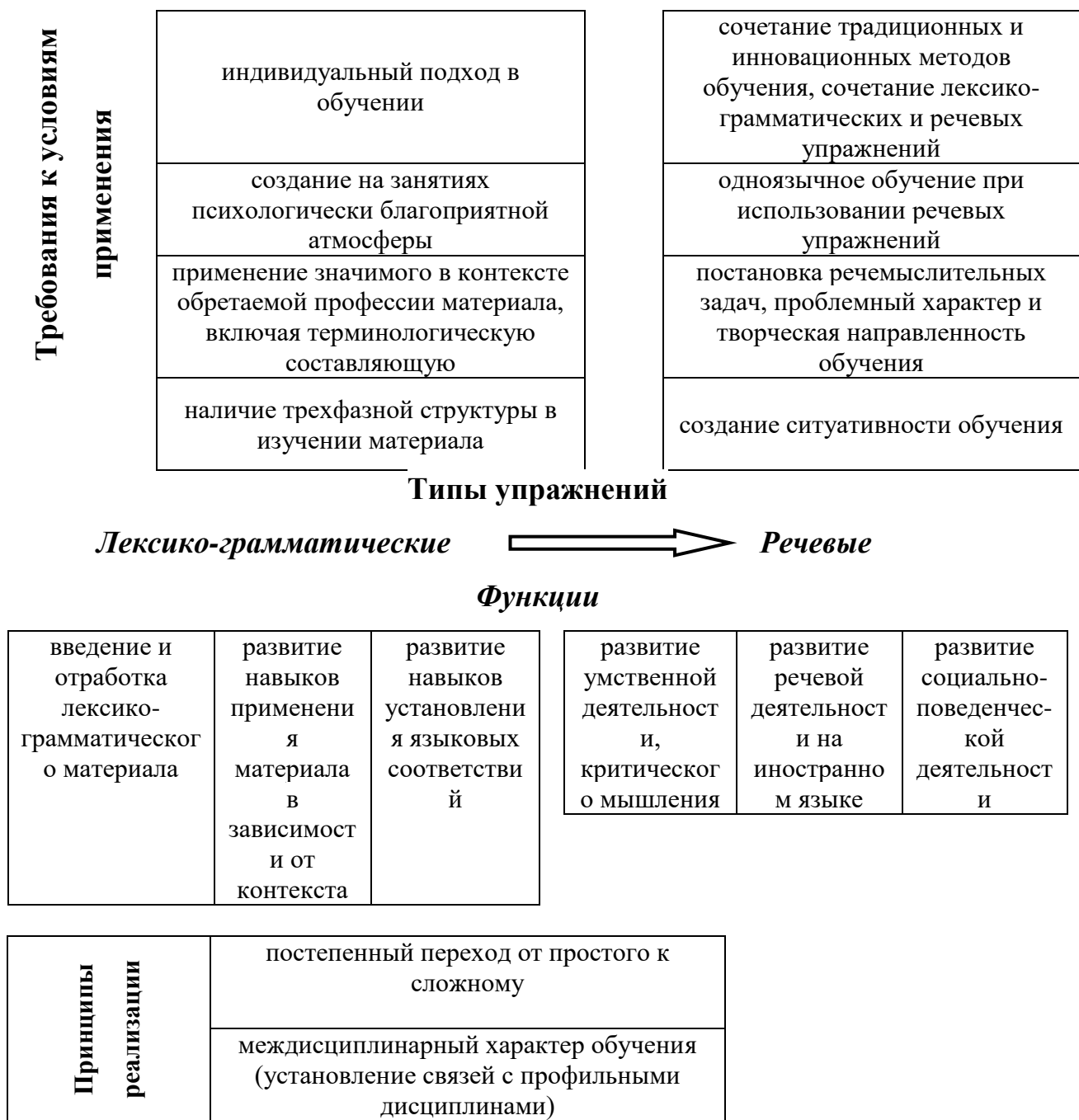
Рисунок 1 – Система упражнений по формированию иноязычной компетенции студентов ВУЗа

Сказанное подтверждают и результаты повторного анкетирования, проведённого на заключительном этапе работы. Большинство опрошенных (98%) хотели бы в дальнейшем обучаться посредством применения в обучении