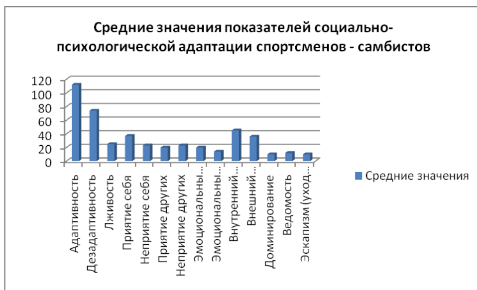
«Рис. 1 Средние значения показателей социально-психологической адаптации спортсменов – самбистов»

приемы ухода или зависимые стратегии, готовы отвечать за совершенные поступки.