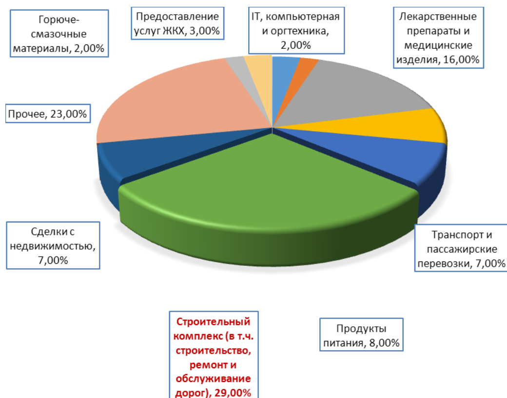
Рисунок 1- Сферы экономической деятельности с наибольшим числом нарушений ст.11, 16 закона о защите конкуренции за 2018 год [41].

На сегодняшний день антиконкурентные соглашения, включая наиболее опасный их вид – картели – широко распространены в сфере государственных закупок, закупок компаний с государственным участием и закупок в сфере государственного оборонного заказа, во всех секторах российской экономики, в том числе имеющих стратегическое значение. Практически треть антиконкурентных соглашений связана с ограничением конкуренции в сфере