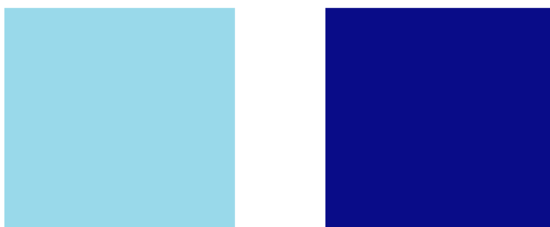
Рисунок 2 – Диагностический материал № 2

К данным фигуркам дети должны подобрать имена из двух предлагаемых лексических абстракций (Малюма и Текете), на основе особенностей звучания. А так же каждой фигурке подобрать цвет из двух предлагаемых цветных квадратиков, один был более светлого, нежного оттенка, а другой — более темного, резкого насыщенного тона (см. рисунок 2).