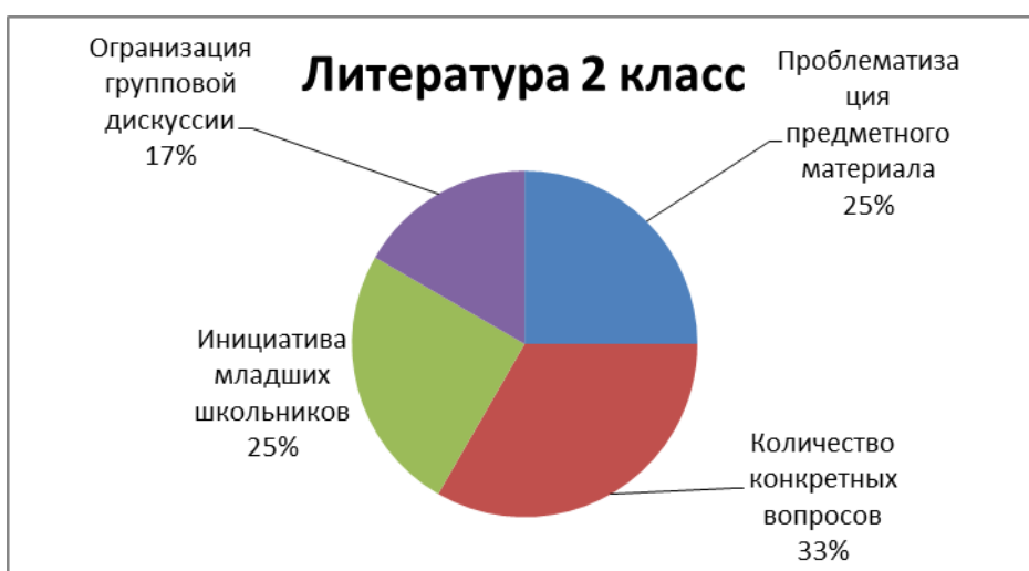
Рис.5 – Результаты анализа протоколов наблюдения на уроках литературного чтения во 2 классе