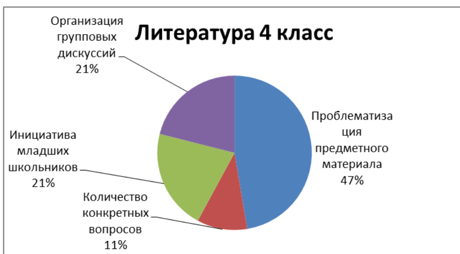
Рис.6 – Результаты анализа протоколов наблюдения на уроках литературного чтения в 4 классе