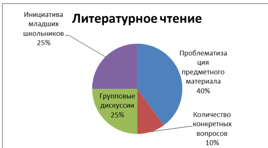
Рис.3 – Результаты анализа протоколов наблюдения на уроках литературного чтения

Далее сравнивали гуманитарные уроки и уроки математики .