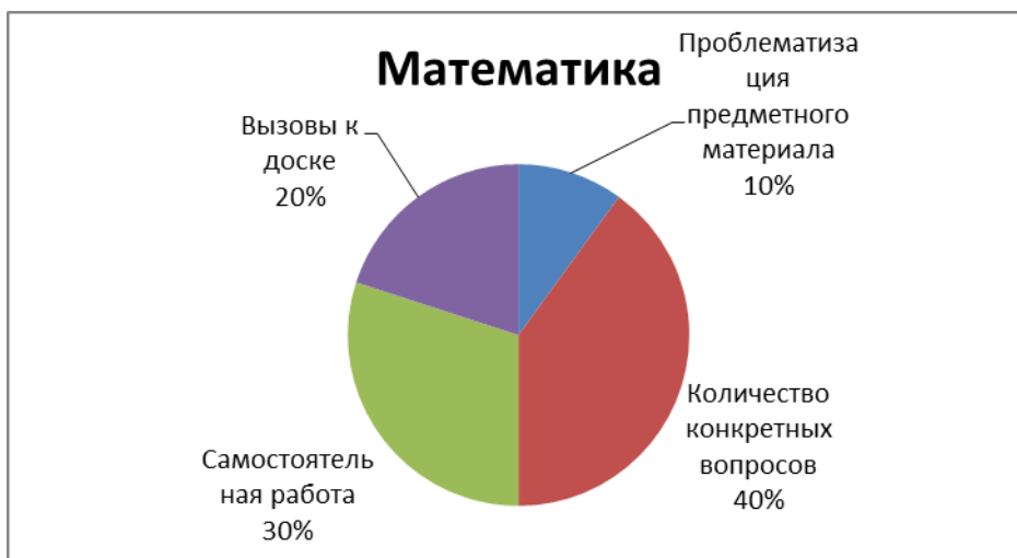
Рис.4 – Результаты анализа протоколов наблюдения на уроках математики