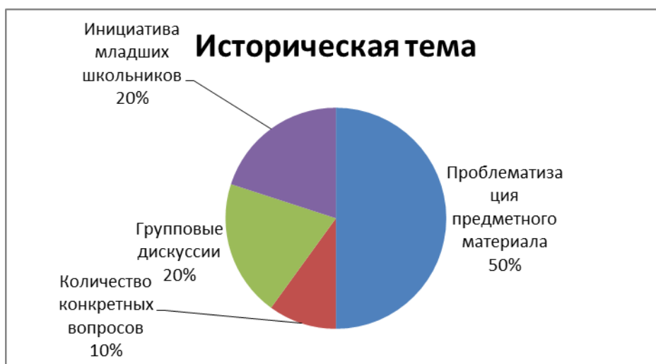
Рис.1 – Результаты анализа протоколов наблюдения на уроках «Окружающий мир» обществоведческой тематики

В работе представлены протоколы наблюдения 10 уроков по различным предметам – математика, литературное чтение, окружающий мир. Проанализирована работа 7 различных учителей с учащимися 2, 3 и 4 классов. Для наглядности и сравнения полученных результатов, нами были составлены диаграммы. В первом случае, мы сравнивали уроки «Окружающий мир» с исторической и естественнонаучной темами.