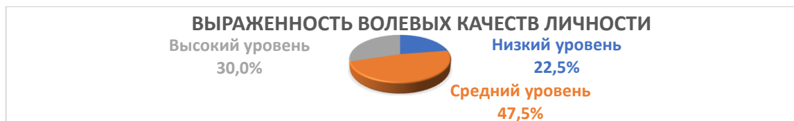
Рисунок 1 – Степень выраженности волевых качеств личности по методике Е. Н. Прощицкой.

В пункте 2.2 «Анализ волевой организации личности в подростковом возрасте» рассматриваются результаты, полученные по методике Е.Н. Прощицкой (см. рис. 1).