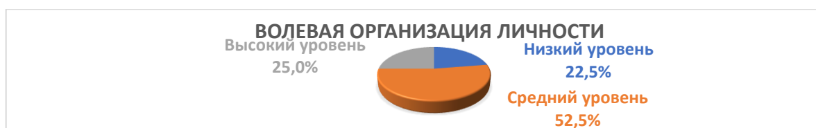
Рисунок 2 – Степень выраженности волевой организации личности по методике А. А. Хохлова.

Для расширенного анализа показателей используем методику «Волевая организация личности» А. А. Хохлова (см. рис. 2).