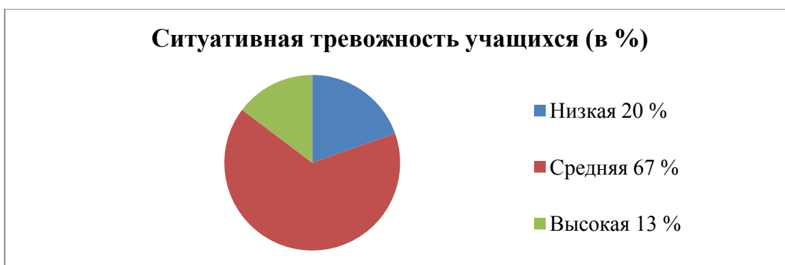
Рисунок 3 - Уровни ситуативной тревожности у учащихся

Результаты ситуативной тревожности учащихся представлены на рисунке 3.