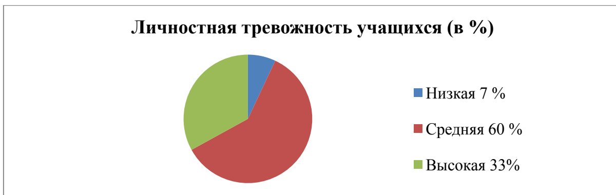
Рисунок 2 – Уровни личностной тревожности у учащихся

Результаты ситуативной тревожности учащихся представлены на рисунке 3.