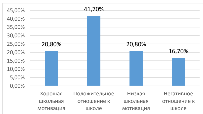
Диаграмма № 2 по результатам исследования мотивации детей старшего дошкольного возраста.

Таким образом, наибольшая часть детей (41,7%) имеет положительное отношение к обучению в школе. Однако 20,8% детей имеет низкую мотивацию и еще 16,7 % детей – негативное отношение к школе. Такие дети неохотно посещают подготовительные занятия к школе, предпочитают пропускать занятия. На занятиях часто занимаются посторонними делами, играми. Испытывают серьёзные затруднения в учебной деятельности