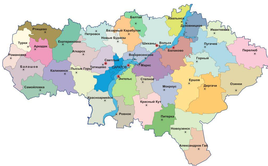
Рисунок 1 – Территория Саратовской области [8]

Саратовская область расположена в европейской части Российской Федерации (РФ), в юго-восточной части Восточно-Европейской равнины на территории Нижнего Поволжья. На севере граничит с Ульяновской и Пензенской областями, на северо-востоке – с Самарской, на востоке – с Республикой Казахстан и Оренбургской областью, на юге – с Волгоградской, на западе – с Воронежской и Тамбовской областями.