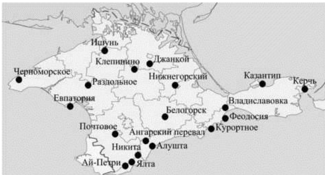
Рисунок 1 - Метеорологические станции Крымского полуострова, данные которых использованы

Крымского полуострова в соответствии с рисунком 1 за период 2011-2019 годов.