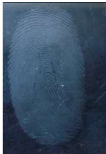
Рисунок 6 – След пальца руки, выявленный на полимерной поверхности

Методы повышения контрастности следов. Выявленные следы обычно представляют собой беловатый налет вещества и в большинстве случаев мало контрастны для проведения дактилоскопических исследований. Выявленные следы можно дополнительно обработать дактилоскопическими порошками, причем установлено, что наилучшие результаты получаются при использовании сажи, которая увеличивает контрастность следа на светлых поверхностях и позволяет копировать след на дактилопленку практически с любой гладкой поверхности. Можно использовать люминесцентные порошки или жидкости (например родамин). Также для повышения контрастности следов может применяться метод термовакuumного напыления. В этом случае тонкая металлическая пленка (алюминий или медь) напыляется не на потожировые отложения, а на уже выявленные с помощью полимера следы. Другую группу методов контрастирования следов, выявленных цианакриловым полимером, составляют химические, в которых используются реагенты, взаимодействующие с материалом следонесущей поверхности (медь и ее сплавы) и относительно инертные к полимеру. Изменить свойства поверхности (цвет или блеск) для повышения контраста можно либо путем травления, либо