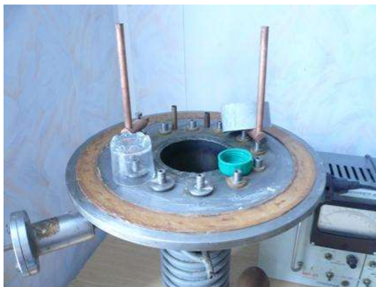
Рисунок 4 – Подколпачное пространство рабочей камеры с подготовленными к выявлению следов рук объектами

10 мин до установления давления 1-3 мм рт. ст., после этого с помощью струбины насос отсоединяли от вакуумной камеры и выключали. Затем объекты «окуривали» парами цианакрилата в течение 30 мин, затем вновь на 1 мин подключали насос для откачки паров клея и установку выключали. С помощью натекателя в камеру плавно напускали атмосферный воздух, колпак убирали и объекты извлекали для визуального осмотра.