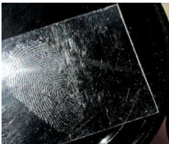
Рисунок 1 – След, выявленный на прозрачном пластике

По истечению времени объекты извлекались из камер и осматривались на предмет выявления следов. Наиболее четко выявились следы на прозрачном пластике, цветном непрозрачном пластике и белом непрозрачном пластике (рисунки 1-3).