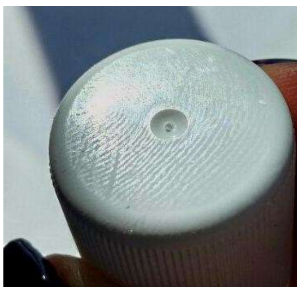
Рисунок 3 – След, выявленный на белом непрозрачном пластике

Выявление следов рук парами эфиров цианакриловой кислоты в вакууме. Для проведения испытаний были подготовлены объекты с различными следовоспринимающими поверхностями со следами рук (гильзы от пистолетных и винтовочных патронов, кусок пластика, стеклянная пластина,