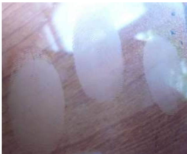
Рисунок 5 – Следы пальцев рук, выявленные на стеклянной поверхности