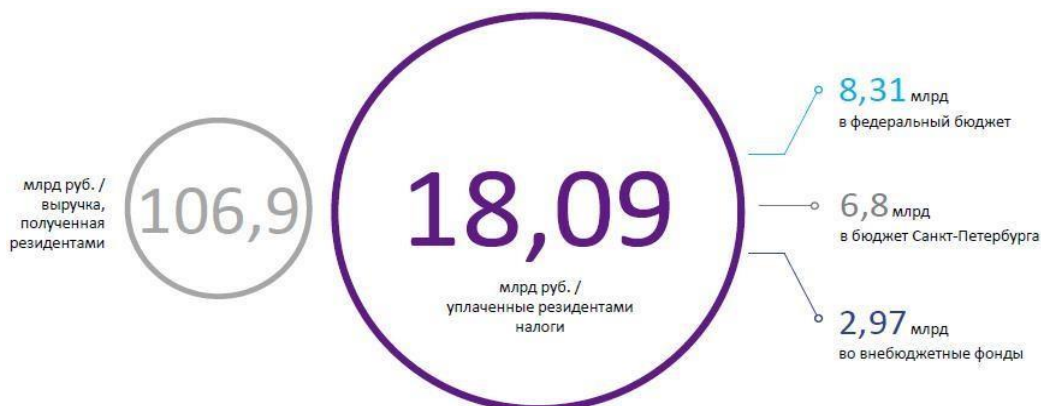
Рисунок 2 - Показатели эффективности

Кроме этого, показателем эффективности работы кластера называют выручку от деятельности предпринимателей и налоговые поступления в бюджет.