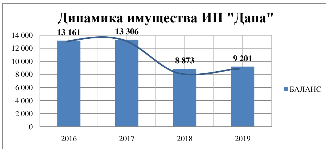
График 2 – Динамика имущества ИП «Дана»

имущества и источников образования имущества. Основную часть в структуре имущества, на протяжении исследуемого периода, занимает дебиторская задолженность, а в структуре источников образования имущества за те же года занимает краткосрочная кредиторская задолженность.