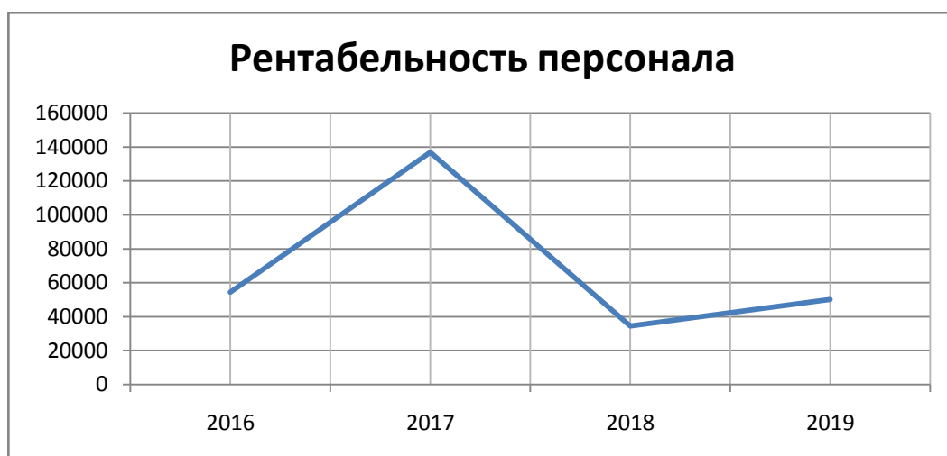
График 1 – Рентабельность персонала