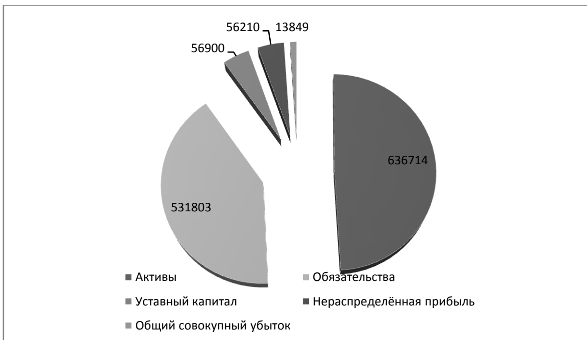
Рисунок 1. Финансовое положение ПАО «Бинбанк» по состоянию на 30 сентября 2018 г.

Анализ финансовой деятельности и статистические данные за 2018 год ПАО «Бинбанк» свидетельствуют о наличии негативных тенденций, которые способны повлиять на финансовую устойчивость банка в перспективе. Надёжность и финансовое состояние банка оценивалось как неудовлетворительное.