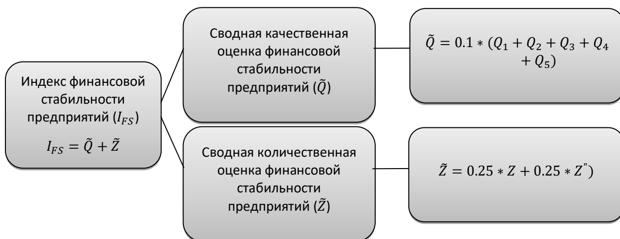
Рисунок 3– Методика оценки индекса финансовой устойчивости предприятий

В основе данной формулы лежит предпосылка о сопоставимо высокой значимости качественной и количественной оценки финансовой устойчивости предприятий, что предопределило выбор удельного веса отдельных показателей.