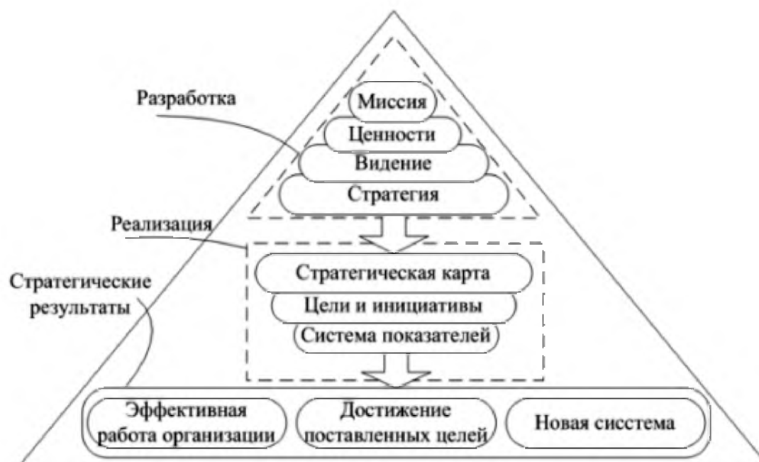
Рисунок 1.3 - Стратегическое управление как система 1

Концепция стратегического планирования может быть представлена в виде схемы (рис. 1.2).