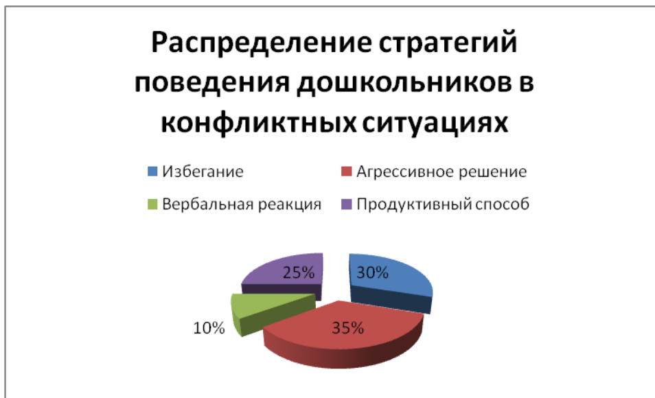
Рис. 2. Распределение стратегий поведения дошкольников в конфликтных ситуациях

В рамках проведенного анализа способов реагирования необходимо говорить, что в старшем дошкольном возрасте сформированы разнообразные стратегии реагирования. На равном уровне сформированности представлены избегание и агрессивный способ реагирования. Что говорит о том, что данная дошкольная социальная среда предрасположена к конфликтному общению. Не только агрессивные способы реагирования, но и физические воздействия могут быть способом реагирования на конфликтную ситуацию.