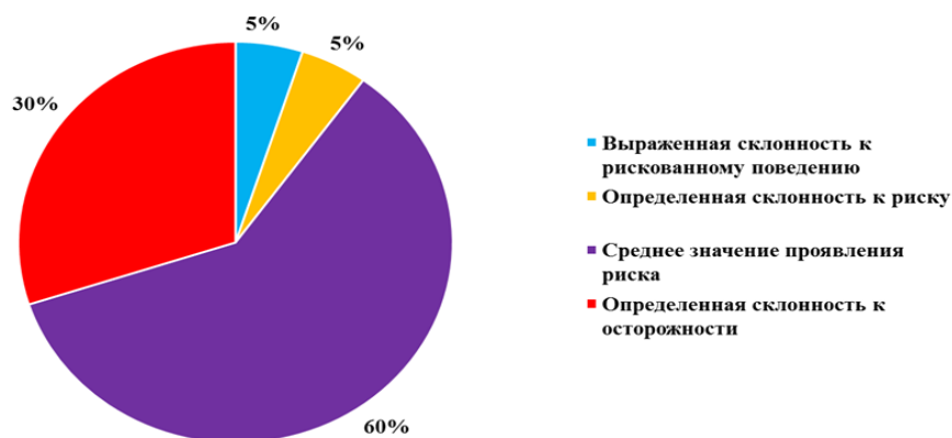
Рисунок 2 — Выраженность шкал в процентах среди девушек.

По методике «Склонность к риску» А. Г. Шмелева высокий уровень проявления склонность к риску выявлен у шести подростков. Данные показатели могут быть связаны с проявлением подросткового кризиса, который характеризуется увеличением количества вырабатываемых гормонов (гормональный всплеск), к тому же, высшие психические функции, отвечающие за прогнозирование результата своего поведения, в данном возрасте сформированы не до конца. Подростки стремятся исследовать свои собственные возросшие возможности, «сломать» границы, которые им установили семья и общество. Юноши и девушки выражают себя, как личности, что является частью развития их идентичности.