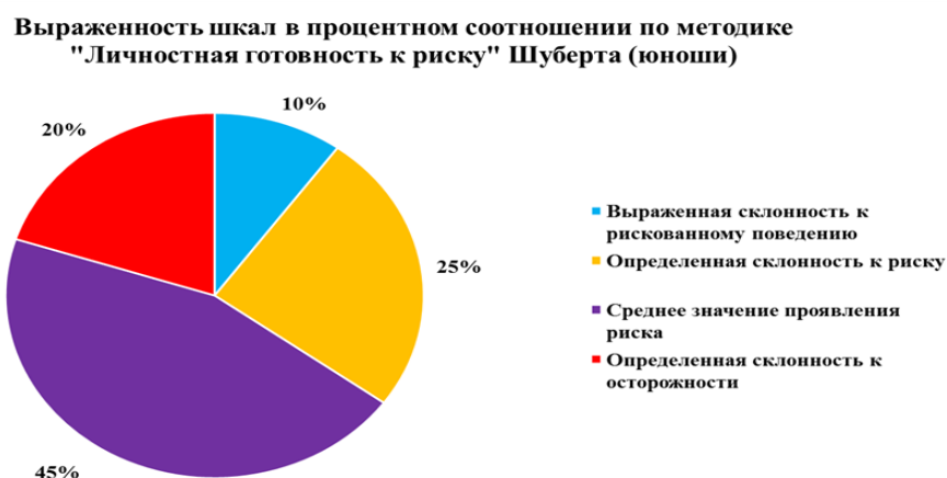
Рисунок 1 — Выраженность шкал в процентах среди юношей.

Выраженная склонность к осторожному поведению – не выявлена.