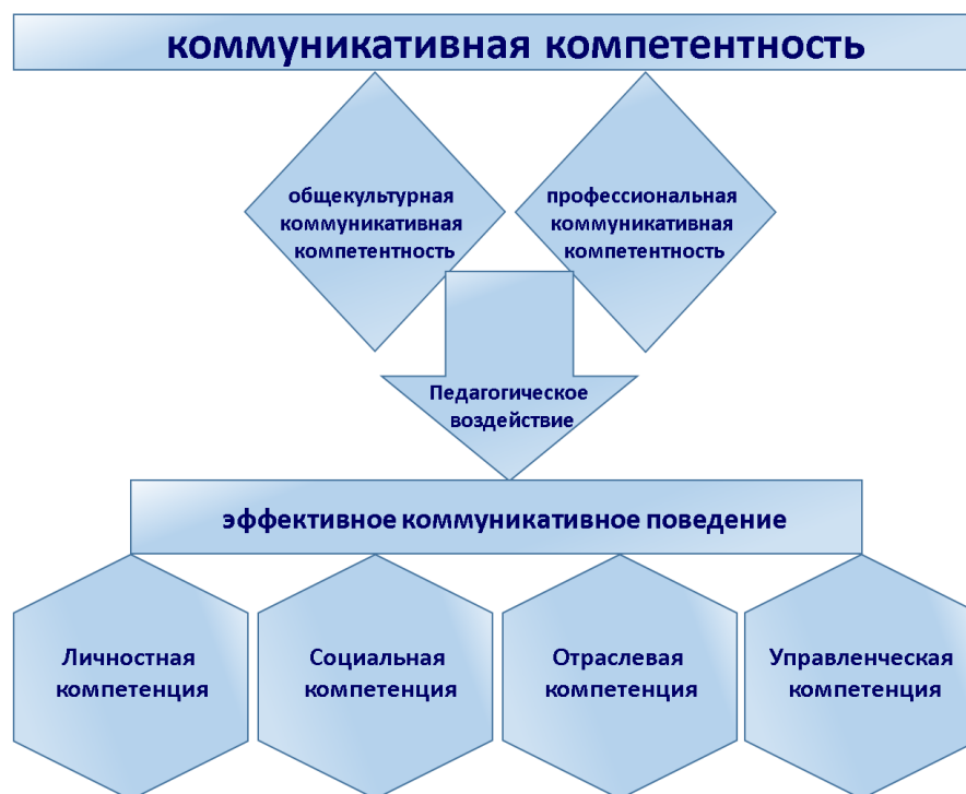
Рисунок 2. Модель формирования коммуникативной компетентности

коммуникативной компетентности и блок-схема алгоритма формирования.