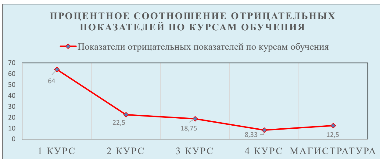
Рисунок 2 - Процентное соотношение отрицательных показателей по курсам обучения

Качественный анализ показал, что испытуемые 4, 6, 17, 19 имеют наиболее низкие показатели суммарно по всем методикам. Испытуемый под номером 4 набрал суммарно низкие показатели по трем методикам (ШОС, САТ, АСвВ), испытуемый под номером 6 набрал суммарно низкие показатели по четырем методикам (ШОС, САТ, АСП, АСвВ), испытуемый под номером 17 набрал суммарно низкие показатели по трем методикам (ШОС, САТ, АСвВ), испытуемый под номером 19 набрал суммарно низкие показатели по трем методикам (ШОС, АСП, АСвВ). Данные студенты с ОВЗ являются обучающимися 1 курса. Проведя дополнительно анкетирование среди испытуемых мы установили, что первокурсники, набравшие средние и высокие результаты обучаются в университете после общеобразовательных школ, благодаря чему адаптироваться в условиях инклюзивного обучения в университете им оказалось не трудно. Первокурсники же набравшие низкие результаты, обучаются в университете после специализированных учреждений. Учет данного фактора является важным звеном в системе психолого-педагогического сопровождения. По результатам анкетирования испытуемых стало известно, что система психолого-педагогического сопровождения оказывает положительное влияние на каждого из испытуемых.