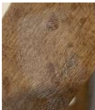
Рисунок 9 – След на деревянной поверхности, выявленный сразу порошком полистирол

Четвертый вид порошка – нитрид бора – бинарное соединение бора и азота. На рисунках 10, 11 представлены следы различной давности, оставленные на гильзе, изготовленной из стали, а также металлической поверхности пистолета, выявленные порошком помолотого нитрида бора.