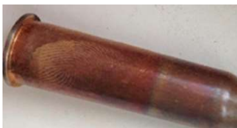
Рисунок 5 – След на покрытой томпаком гильзе выявленный сразу порошком алюмосиликат

Второй вид порошка – алюмосиликат, который является природным минералом, комплексные анионы которого содержат кремний и алюминий. На рисунке 5 изображен след пальца руки, оставленный на гильзе, покрытой томпаком, выявленный сразу порошком алюмосиликат, а на рисунке 6 след, выявленный через день на пластиковой поверхности рукояти пистолета порошком алюмосиликат.