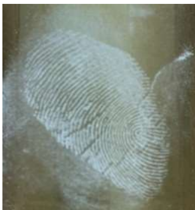
Рисунок 4 – След на пластиковой крышке, выявленный через день порошком силикагель

На рисунке 4 изображен след пальца руки однодневной давности, оставленный на пластиковой поверхности, выявленный порошком силикагель.