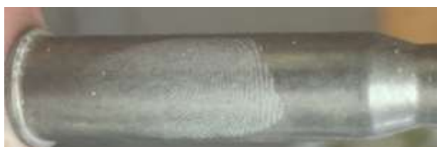
Рисунок 10 – Следы на стальной гильзе, выявленный сразу порошком нитрида бора

Четвертый вид порошка – нитрид бора – бинарное соединение бора и азота. На рисунках 10, 11 представлены следы различной давности, оставленные на гильзе, изготовленной из стали, а также металлической поверхности пистолета, выявленные порошком помолотого нитрида бора.