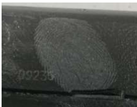
Рисунок 11 – След однодневной давности на металлической части пистолета, выявленный порошком нитрида бора

На рисунке 12 представлен след, оставленный металлической наковальне, выявленный порошком нитрид бора.