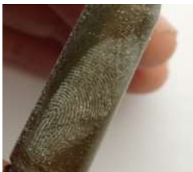
Рисунок 8 – След однодневной давности на лакированной гильзе, выявленный порошком полистирол

Третий вид порошка – полистирол. На рисунках 8, представлен след, оставленный на лакированной гильзе, выявленный порошком полистирол.