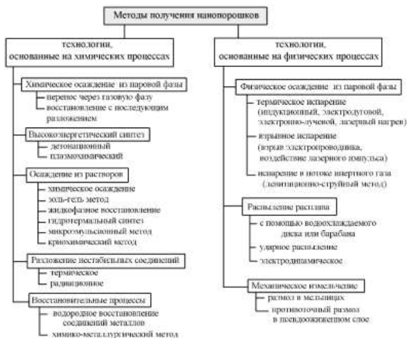
Рисунок 1 – Методы получения порошков

Методы получения порошков. В настоящее время известно большое количество способов получения наночастиц, которые различаются не только в методах, которые лежат в их основе, но сложности и длительности процесса. На рисунке 1 представлены методы получения мелкодисперсных порошков.