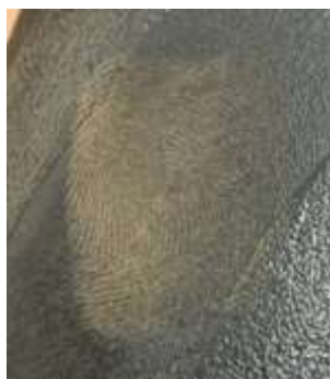
Рисунок 6 – След на пластиковой поверхности пистолета, выявленный через день порошком алюмосиликат

На рисунках 7 представлен след пальца руки, оставленный на пластиковой поверхности, выявленный через день порошком алюмосиликат.