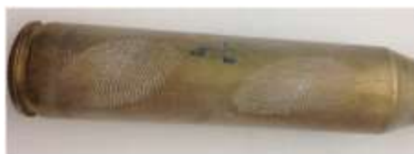
Рисунок 3 – Следы на латунной гильзе, выявленные сразу порошком силикагель

На рисунке 4 изображен след пальца руки однодневной давности, оставленный на пластиковой поверхности, выявленный порошком силикагель.