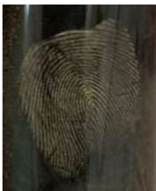
Рисунок 7 – След на пластиковом флаконе, выявленный через день порошком алюмосиликат

На рисунках 7 представлен след пальца руки, оставленный на пластиковой поверхности, выявленный через день порошком алюмосиликат.