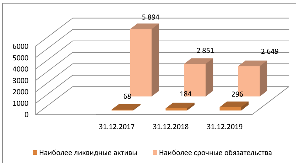
Рисунок 1– Соотношение наиболее ликвидных активов и наиболее срочных обязательств ОАО «СКХ» за 2017-2019 гг. (тыс. руб.)

стоимость наиболее ликвидных активов должна быть больше стоимости наиболее срочных обязательств. На протяжении всего анализируемого периода данное условие не соблюдалось. В связи с этим сформировался дефицит наиболее ликвидных активов, предназначенных для покрытия наиболее срочных обязательств. Сумма этого дефицита составляла: на 01.01.2017 – 3 927 тыс. руб.; на 31.12.2017 – 5 826 тыс. руб.; на 31.12.2018 – 2 667 тыс. руб.; на 31.12.2019 – 2 353 тыс. руб. Соотношение наиболее ликвидных активов проиллюстрировано на рисунке 1.