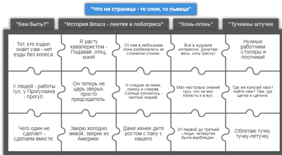
Рисунок 3. Задание-пазл «Угадай строчку из стихотворения» Сетевой адрес: https://learningapps.org/watch?v=prfiokdt321

На рисунке 3 представлено задание-пазл «Угадай строчку из стихотворения».