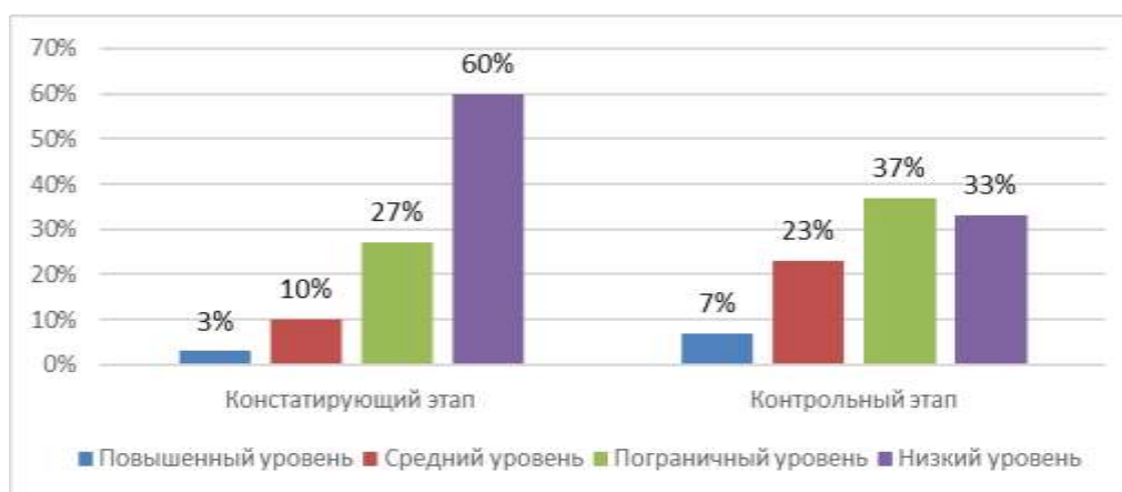
Рисунок 3 – Сравнительные результаты констатирующего и контрольного этапа исследования в Г2