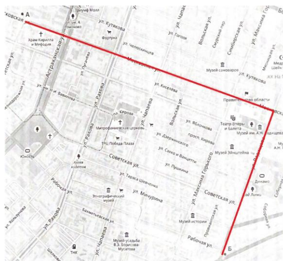
Рисунок 2 – Самый популярный маршрут (составлено автором по результатам опроса)

Исходя из всего сказанного мною, и проанализировав результаты данного исследования я составил маршрут, который отражает приоритетные для прогулки улицы. Он выглядит следующим образом: