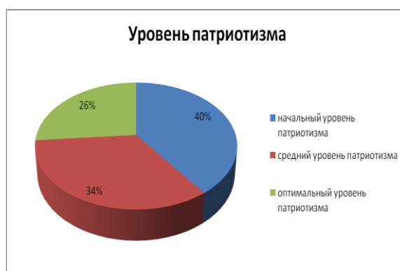
Рисунок 2 — Уровень патриотизма

2 блок – анализ данных, полученных с помощью вопросов «Патриотизм – это...»