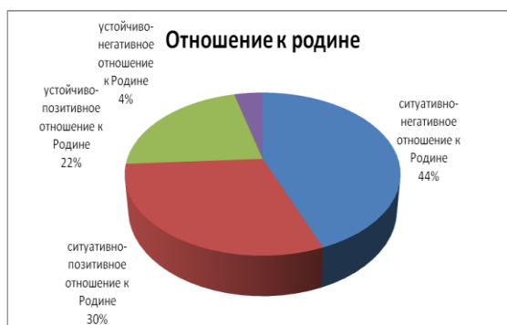
Рисунок 3 — Отношение к Родине

3 этап – диагностика патриотизма обучающихся с помощью вопросов «Личностный рост обучающихся».