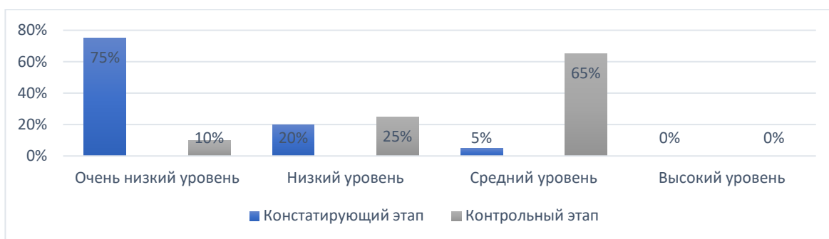
Рисунок 2 – Сравнительный анализ уровня развития устойчивости внимания у младших школьников с ЗПР между констатирующим и контрольным этапами исследования

Здесь мы также наблюдаем положительное изменение, где, на констатирующем этапе исследования, преобладал очень низкий уровень развития устойчивости внимания – 75 % учащихся с ЗПР. На контрольном этапе мы видим, что этот уровень поднялся до среднего у 65 % младших школьников. Динамика прослеживается.