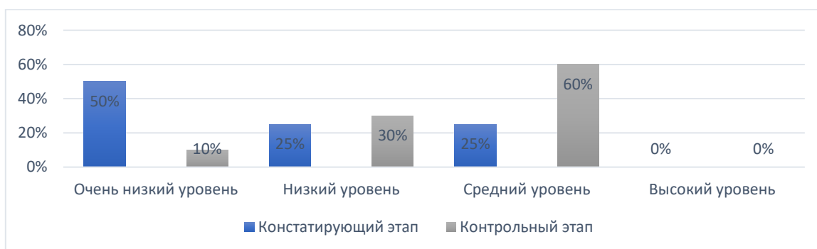
Рисунок 1 – Сравнительный анализ уровня развития продуктивности внимания у младших школьников с ЗПР на констатирующем и контрольном этапах исследования

В главе 2 представлены результаты эмпирического изучения нарушений внимания младших школьников с задержкой психического развития. Сравнительный анализ результатов контрольного и констатирующего этапов исследования представлен на рисунках 1, 2, 3, 4.