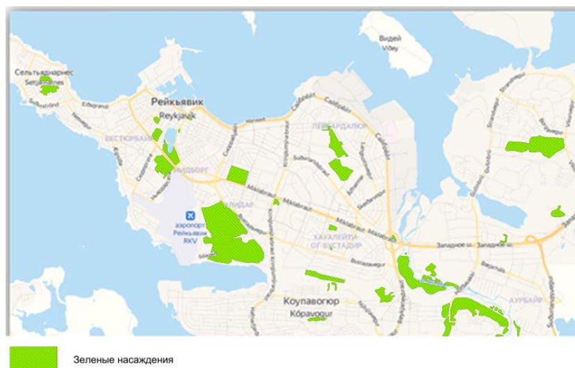
Рисунок 6 –Карта озеленения города Рейкьявик (Авдотыина, Л.Н., 1989)

Густые исландские леса исчезли в истории в результате катастрофического извержения вулкана около тысячи лет назад. Вторым фактором катастрофы послужил тот факт: что растительность практически полностью была уничтожена первыми поселенцами в период первых сотен лет следом после заселения острова (рисунок 6). Тем не менее граждане убеждены, что нужно вновь первоначальный облик и наблюдать то на сколько Исландия может быть зеленой.