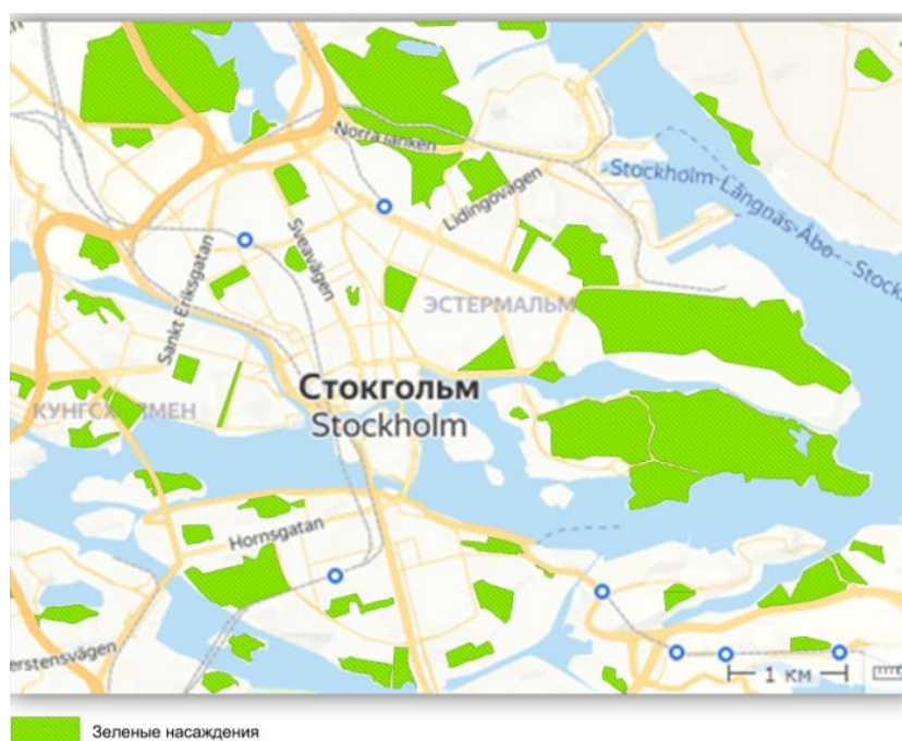
Рисунок 8 – Карта озеленения города Стокгольма, Швеция (Боголюбов, С.А., 2018)

земле. Стокгольм был и также первым городом, заработавшим статус Зеленой столицы Европы ещё в 2010 г. (Залунин, В.И., 2019, с.84)