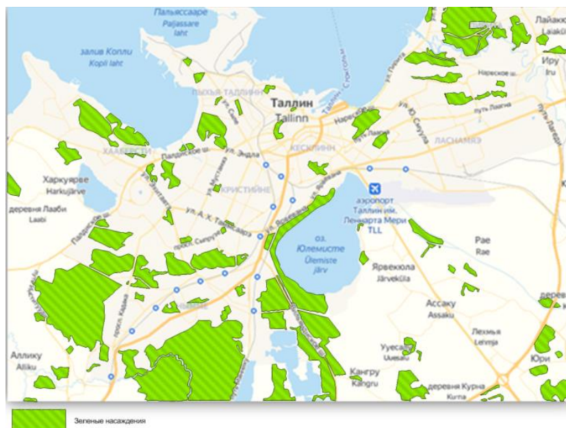
Рисунок 3 – Карта озеленения города Таллина, Эстония (Зелёные насаждения как метод защиты от шума и вредных выбросов двигателей внутреннего сгорания в сельской местности, 2017, С.173-176)

Чаще всего в городах начинается неравенство в том, кому доступно использование зеленых зон, как легко в них оказаться людям с особенными потребностями. В работах Европейского агентства в качестве образца в этом отношении приведен Сенсорный сад в Таллинском ботаническом саду. Сад предназначен для людей с особенными привилегиями, то есть любителей садоводства или любителей, выражающий интерес к съедобным и лечебным растениям, а также школьников и гурманов. В этом месте можно следить за ростом растений, трогать и нюхать их, а время от времени даже пробовать.