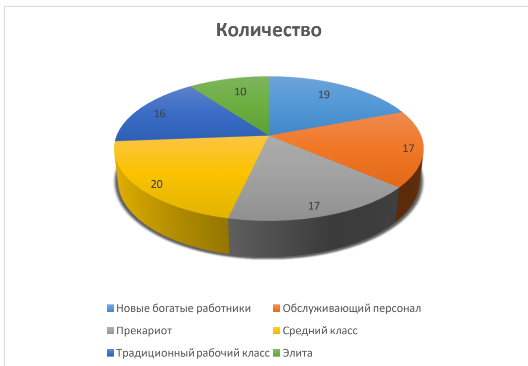
Рисунок 1.2 – Диаграмма количества представителей социального класса

В третьем разделе, “Тестирование калькулятора и исследование социального капитала в обществе” автор тестирует информационную систему на работоспособность, а также приводит результаты исследования уровня социального капитала жителей города Саратов, исходя из результатов опроса, проведенного по квотной выборке. На рисунке 1.2 представлена круговая диаграмма количества представителей опрашиваемых людей.