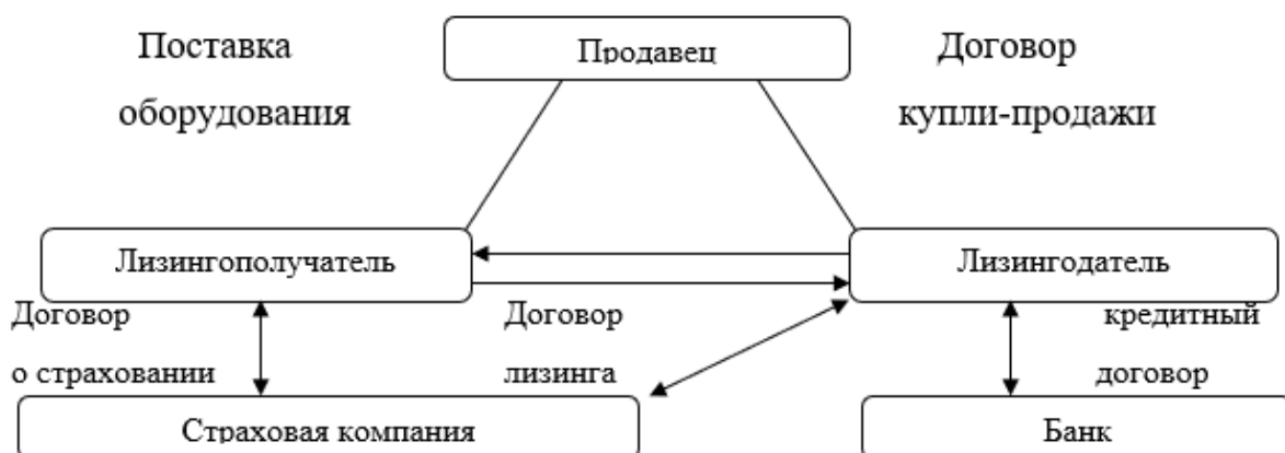
Рисунок 2 – Схема лизинговой сделки

Представленный рисунок позволяет отметить, что если лизингополучатель не может самостоятельно приобрести оборудование или машину, привлекается банковская организация, которая осуществляет финансирование на определенных условиях.