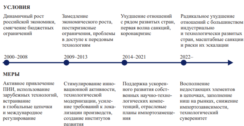
Рис. 1 – Российская политика импортозамещения

История появления импортозамещения связана с различными историческими периодами, краткая характеристика которых представлена на рисунке 1, в том числе с изменениями в мировой экономике, ростом импортозависимости и стремлением к развитию собственного производства.