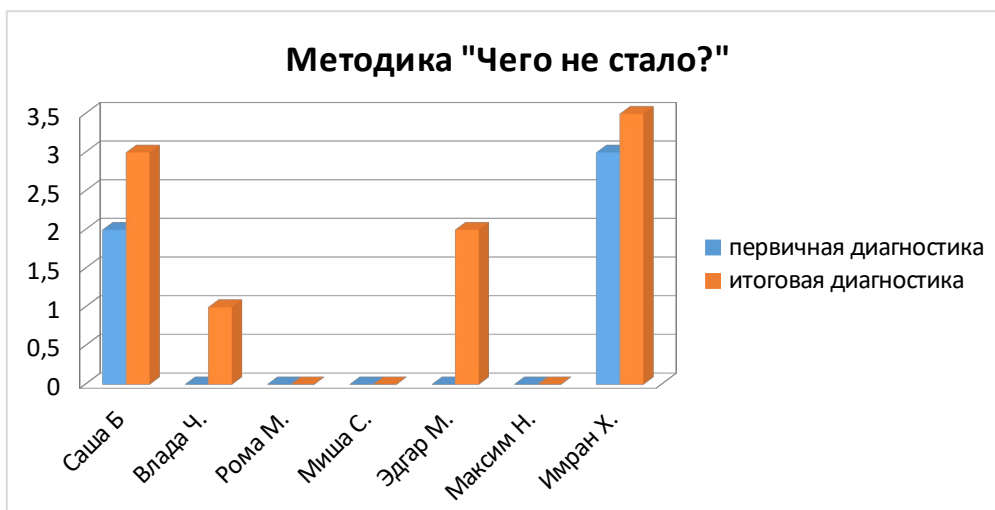
Рис.1. – График сравнения результатов по методике «Что не стало?».