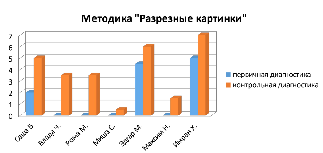
Рис.3. – Сравнительный результат исследования по методике «Разрезные картинки»