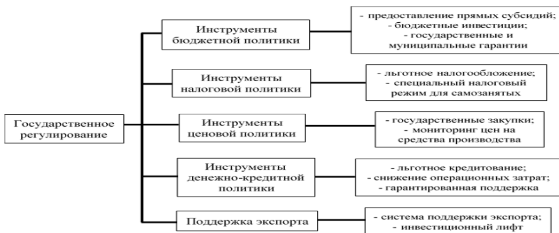
Рисунок 1 – Основные инструменты государственной поддержки малого бизнеса

Основными направлениями государственной стратегии по развитию малого предпринимательства в Российской Федерации являются формирование комфортных условий для работы малых предприятий и активная поддержка их товаров на рынке.