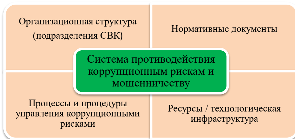
Рисунок 2 Система противодействия коррупционным рискам и мошенничеству

Система противодействия коррупционным рискам и мошенничеству включает несколько ключевых компонентов: организационную структуру, нормативные документы, процессы и процедуры управления рисками, а также ресурсы и технологическую инфраструктуру (см. рисунок 2).