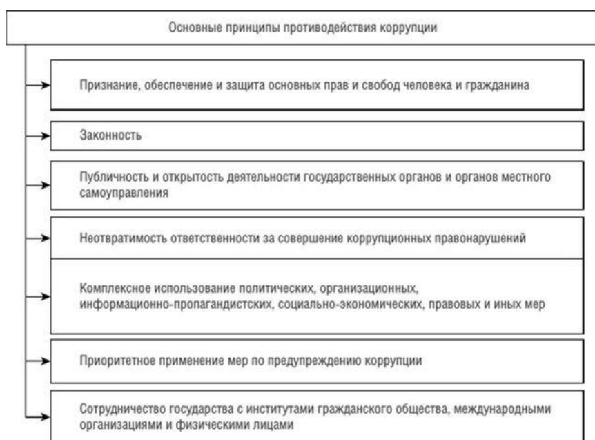
Рисунок 1 Основные принципы противодействия коррупции

Противодействие коррупции в Российской Федерации основывается на следующих основных принципах, представленных на рисунке 1.