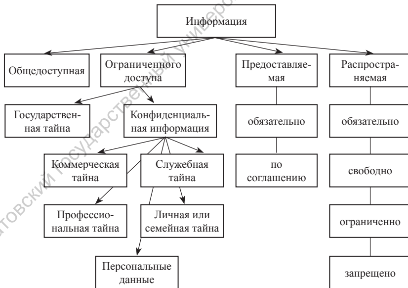
Рис. 2. Классификация информации по закону «Об информации, информационных технологиях и о защите информации» от 27 июля 2006 г. № 149-ФЗ