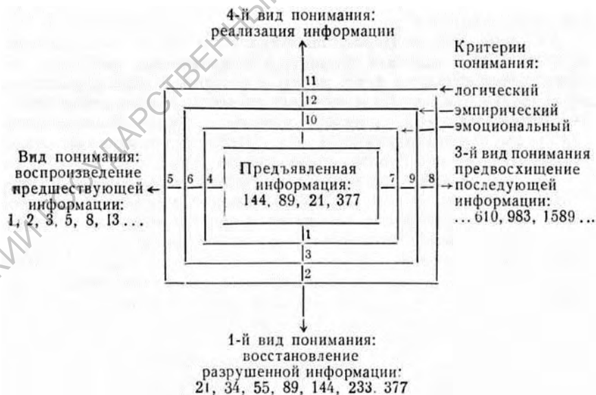
Рис. 1.3. Психологическая типология понимания на примере чисел ряда Фибоначчи.

Каждый вид понимания имеет три критерия понимания: эмоциональный, эмпирический и логический (рис. 1).