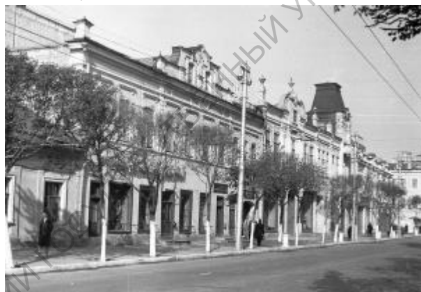
Здание расположено по адресу проспект Кирова, дом.