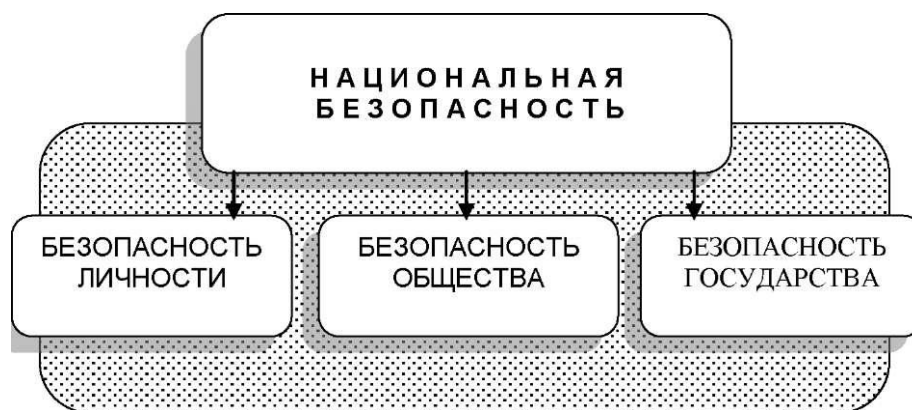
Рис. 2. Классификация видов национальной безопасности (по объектам)

Вместе с тем в этом законе конкретизированы основные принципы обеспечения безопасности, в их числе: