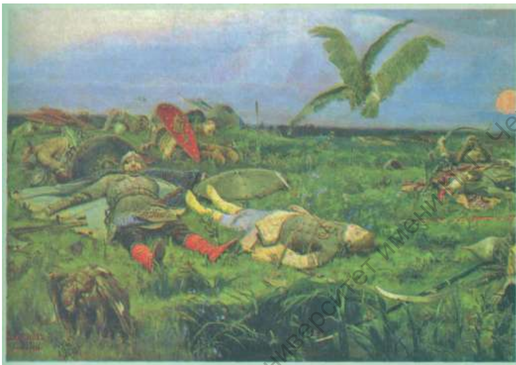
В.М. Васнецов «После побоища Игоря Святославича с половцами»

Древнем Риме был бог Янус, хозяин Времени. В его честь воздвигали храмы, ему приносили дары, возжигали огонь. Почему он двулик? Почему у него разные лица и смотрит он в разные стороны? Потому что одно лицо обращено в будущее время, другое - в прошлое. Вот о чем я вас попрошу, внимательно посмотрите на этого хозяина Времени и по желанию воплотите его или в рисунке, или в лепке.