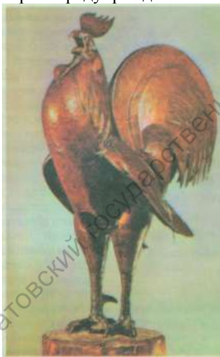
И. Ефимов «Петух»

Почему «Петух»? Птица не экзотическая, не дикая, а вполне привычная, домашняя. Ефимов, обыгрывая возможности материала, из которого он исполнен (кованая медь), придает ему не только характерные черты, сближающие с человеком, но и наделяет этот образ символическим содержанием. Скульптор возносит мирную домашнюю птицу «на пьедестал» (не беда, что это обыкновенный чурбан). Силуэт «Петуха» с острыми перьями хвоста, с крепким бойцовским клювом, жилистыми лапами, украшенными угрожающими шпорами, убеждает зрителя: это настоящий боец и задира. А круто вздымающаяся «грудь колесом», горделиво распахнутые крылья, победно венчающий голову пламенеющий гребень свидетельствуют о том, что он преисполнен осознанием важности своей миссии. И тому подтверждение - его победный крик, провозглашающий рождение нового дня. На кого из сказочных героев похож этот петух? Конечно, на пушкинского золотого петушка, который предупреждал об опасности.