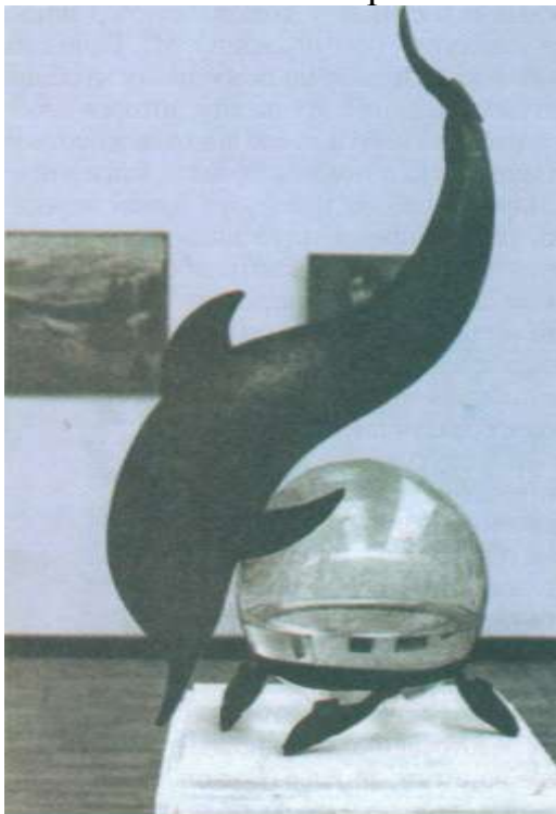
И. Ефимов. Дельфин

обрисована грация тех животных, кого он представляет: демонстрирует самые яркие качества, будь то движение или готовность к нему. Неутомимый изобретатель и неиссякаемый выдумщик, Цаплин, чтобы подчеркнуть характер дарований своих героев, обращался к самым неожиданным материалам, разрабатывал самые смелые композиции. Пример чудесного эксперимента - его «Дельфин». Эта удивительная скульптура была предназначена для фонтана на Речном вокзале на севере Москвы.