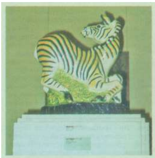
И. Ефимов. Зебра

Ефимову удалось создать такую форму, в которой сконцентрировано разнонаправленное движение. Обратите внимание детей на сложность и выразительность силуэта зебры - он словно закручен в сжатую пружину. Силуэт - ключ для рассказа о том, что произошло с зеброй, о том, что ей грозит и как она себя поведет через какое-то время. Поэтому педагог спрашивает: «Представьте, что мы подкрались к отдыхающей зебре тихо и незаметно, но она вдруг резко обернулась. Что случилось?». Если дети затрудняются ответить на вопрос, педагог быстро и неожиданно хлопает в ладоши. И ответ дети - тому свидетельство наша практика - немедленно находят: «Зебра резко обернулась на настороживший и испугавший ее звук». Рассматривая удивительную окраску скульптуры, педагог отмечает, что полосы у зебры не черные, а синие, а само тело не белого, а чуть желтовато-коричневого цвета (особенно на крупе). Вот почему оно имеет «загорелый» оттенок. Расцветка подскажет ответ на вопросы: «Где спрячется зебра после своего бегства? (Конечно, в зарослях кустарника.) Почему шкура зебры кажется немного загорелой?».