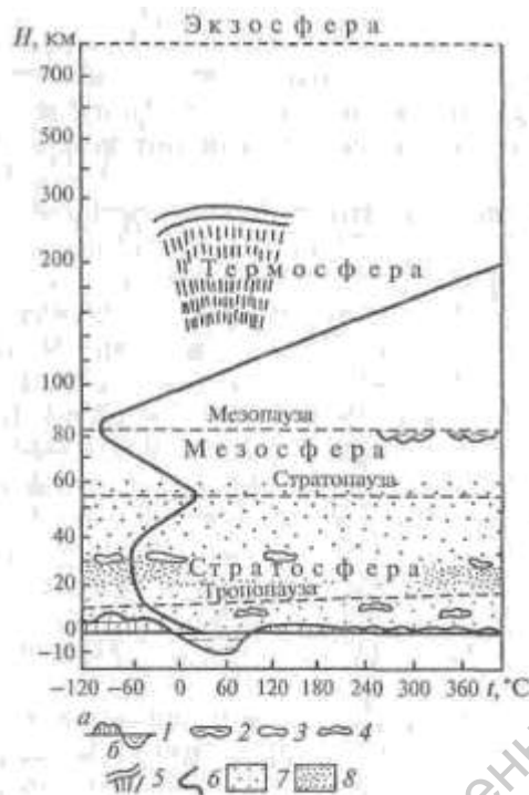
Рис 1 Схематический разрез атмосферы. 1 — верхняя граница литосферы (а — суша, б — океан); 2 — серебристые облака; 3 — перламутровые облака; 4 — ярусы облачности в тропосфере; 5 — полярные сияния; б — температурная кривая; 7 — слой распространения озона; 8 — слой наибольшей концентрации озона (озоновый слой) [1].

формы природных вод: воды, находящиеся в магматических расплавах, в химических соединениях в минералах и горных породах, сорбированные поверхностью минеральных зерен, в капиллярной осмотической, в вакуольной и биологически связанной формах. Сюда же относится вода в газообразном, жидком и твердом состоянии. Все формы воды взаимосвязаны друг с другом и постоянно переходят одна в другую, взаимодействуют с другими сферами. Высока вероятность перехода воды в кристаллическую решетку минералов, которые при повышении температуры теряют воду. Вода является активным участником всех природных процессов, происходящих как на поверхности Земли, так и в ее недрах.