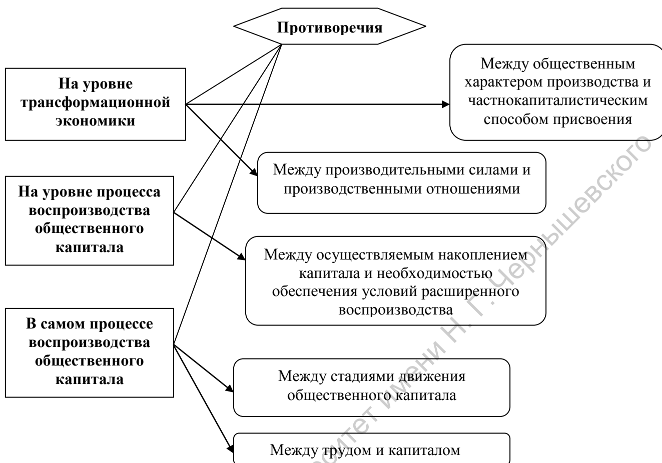
Рис. 2. Система противоречий воспроизводства капитала в условиях трансформации экономической системы

Рассматривая все противоречия отображенные на рисунке 2, то логичнее следует начинать анализ с такого противоречия которое возникает и действует объективно на почве экономических отношений и определенных специфически-исторических систем. Таковым противоречием является противоречие между общественным характером производства и частнокапиталистическим способом присвоения. Это есть основное противоречие имманентное любой экономике, в том числе трансформационной, формирующее структуру экономического строя данного общества. Данное противоречие выступает как источник развития трансформационной экономики и как инструмент описания ее функционирования.