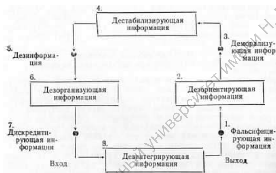
Рис. 4. Психологический механизм интеллектуальной экспансии при неадекватной политике.

ющей систему административного управления, разрушающей общественный порядок, приводящей к развалу хозяйственной и финансовой деятельности. Практичная информация седьмого уровня в случае неадекватной политики заменяется развращающей информацией. На восьмом уровне - начале и конце всей системы принятия политического решения необходимая информация подменяется информацией дезинтегрирующей , разъединяющей неразрывно связанное целостное единое общество на соперничающие, противоборствующие части 93 .