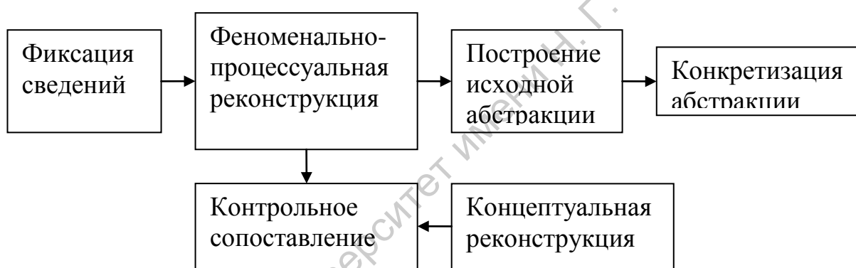
Рис.2. Этапы экспертной деятельности