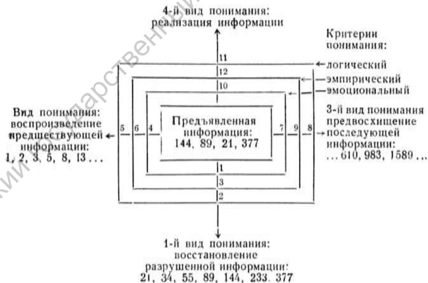
Рис. 1.3. Психологическая типология понимания на примере чисел ряда Фибоначчи.

Каждый вид понимания имеет три критерия понимания: эмоциональный, эмпирический и логический (рис. 1).